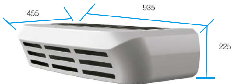
Condensador Dimensiones 935×455×225(L×W×H/mm)